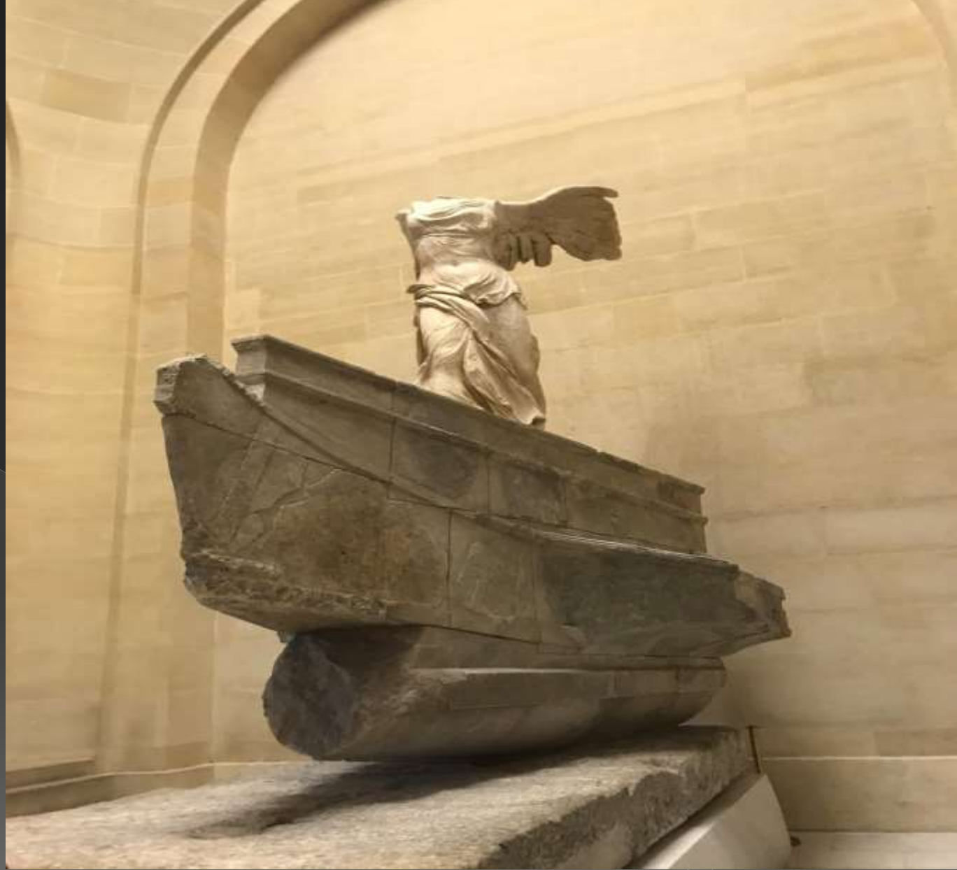
Nike di Samotracia