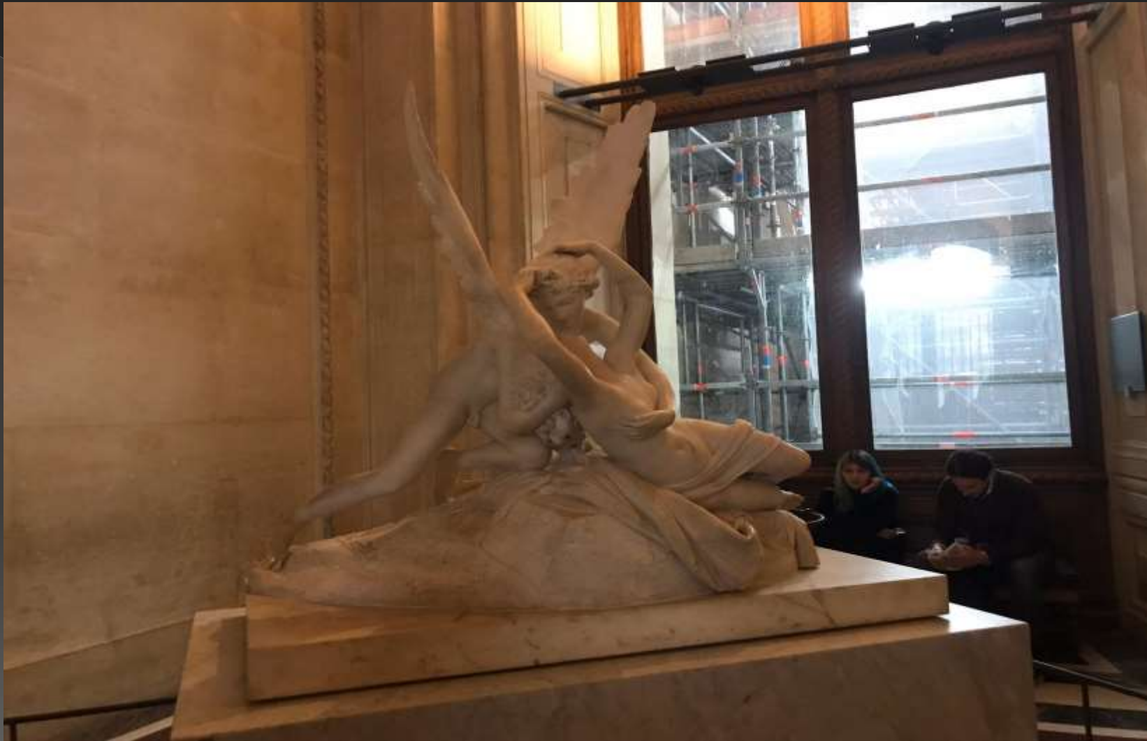
Antonio Canova «Amore e Psiche»