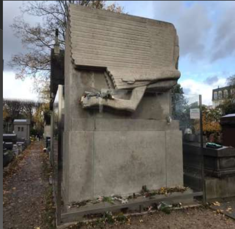
Tomba di Oscar Wilde