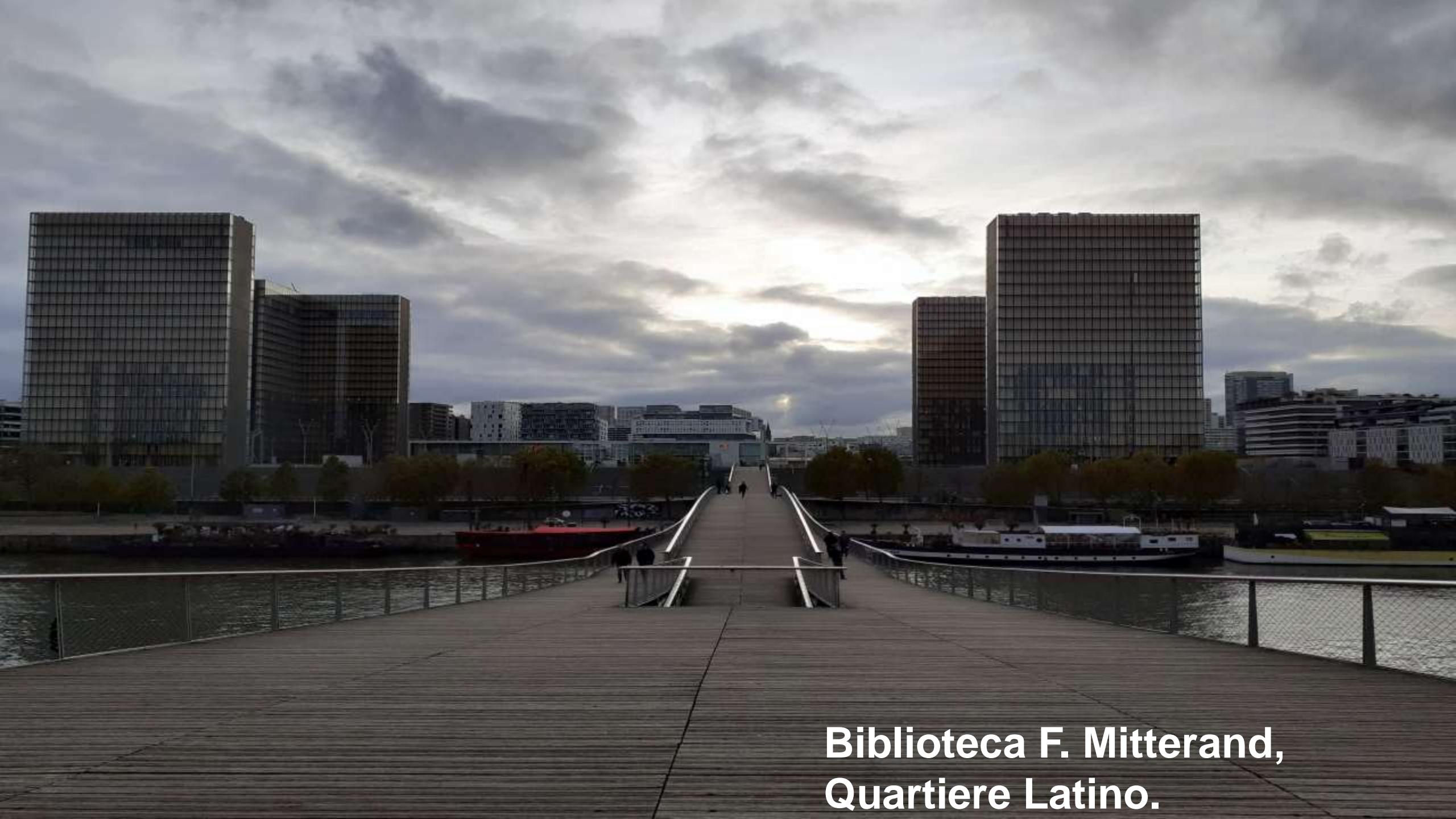
Biblioteca F. Mitterand, Quartiere Latino.