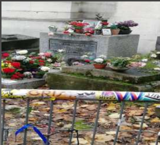
Tomba di Jim Morrison