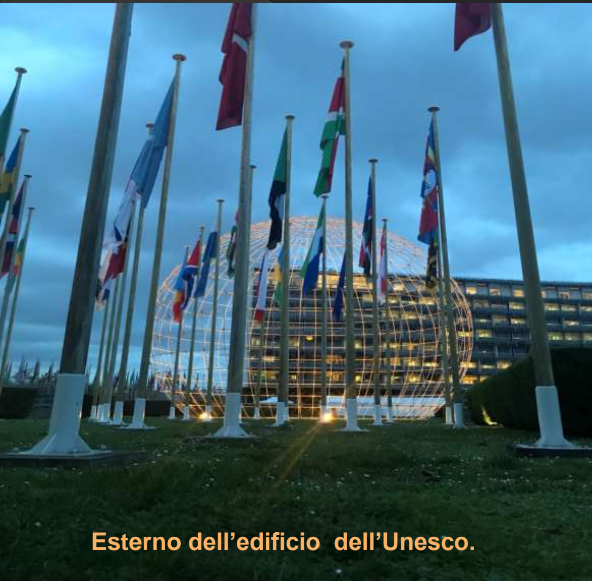
Esterno dell'edificio dell'Unesco.

È una delle organizzazioni delle Nazioni Unite . Ne fanno parte 195 paesi del mondo. Tra i diversi compiti svolti la principale è quella di proteggere e conservare siti considerati patrimonio dell'umanità, importanti sia dal punto di vista artistico che naturalistico. Una delle tante iniziative educative che porta avanti l'Unesco è quella legata ai problemi derivanti dai cambiamenti climatici.