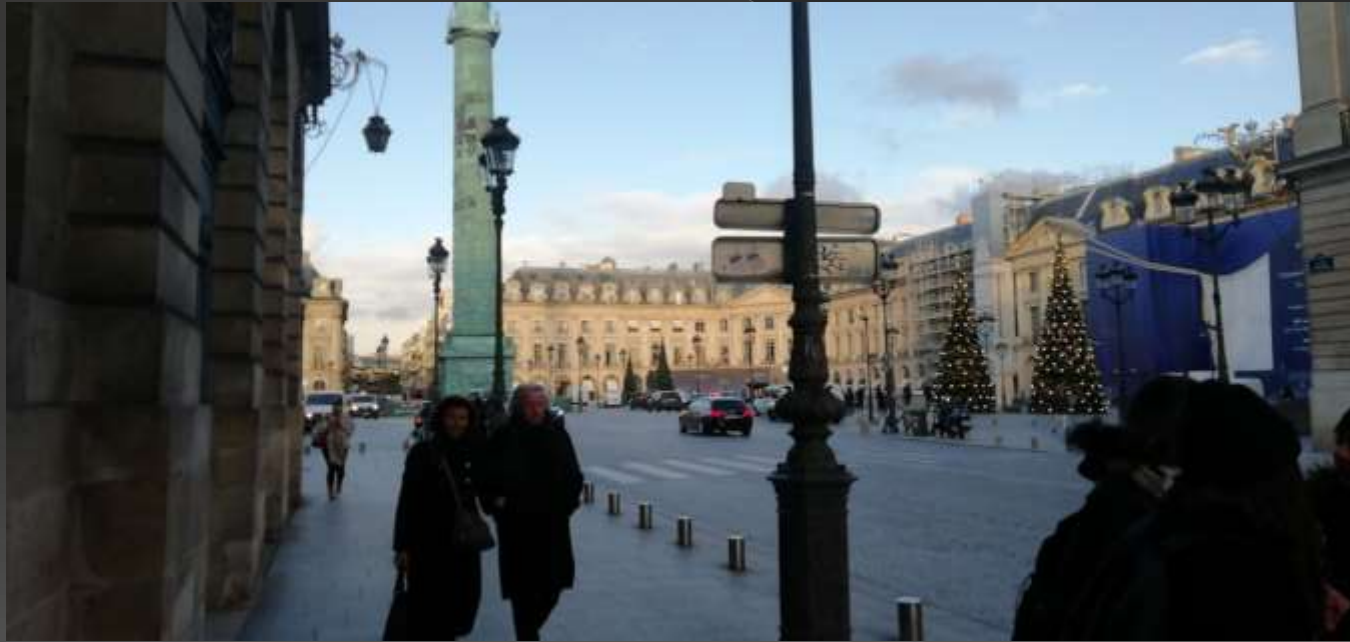
Colonna di Austerlitz